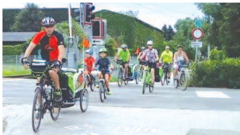
Kerékpáron a család

A szakemberek felszólították a világ kormányait, hogy hozzanak létre és tartsanak fenn megfelelő infrastruktúrát a sportolás, valamint a közlekedésben a gyaloglás és a kerékpározás támogatására. (MTI)