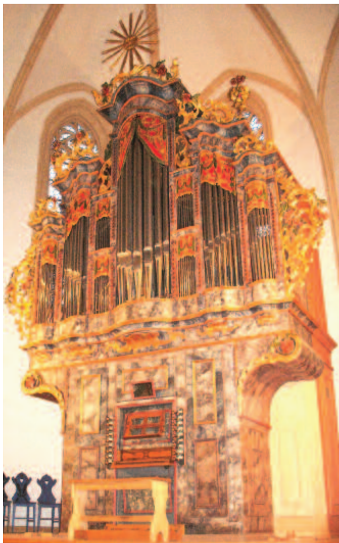
A Vártemplom műemlék orgonája

– A 15. Nyáresti hangversenysorozaton kívül volt két fellépésem, a Kilyén Ilka színművésznővel közösen kiadott CD bemutatója a marosvécsi református templomban, majd a Bolyai téri unitárius templomban a Marosvásárhelyi Forogtag keretében. A hét végén, szeptember 9-én, vasárnap fellépek a Kultúrpalotában, a magyar dal napja alkalmából egy Liszt Ferenc, Bartók Béla, Csiky Boldizsár, Kozma Mátyás és Terényi Ede műveiből álló összeállítással. Szeptember közepén a Kultúrpalotában egy másik rendezvényen játszom, októberben a filharmónia szervezésében egy esten hazai kortárs orgonaművekből mutatok be, és sok egyéb tervem van, de most még élvezem a szünet utolsó napjait az új egyetemi évre készülve.