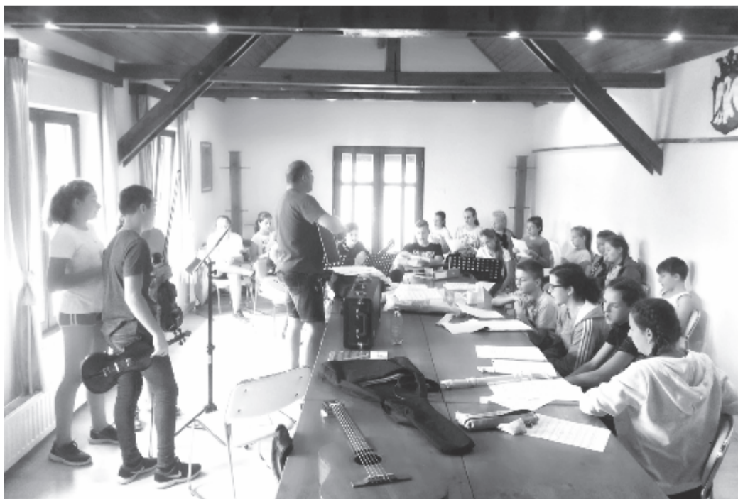
A zenészek és énekesek hat új dalt tanultak meg új műsorukhoz

A felvételi vizsgák szeptember 17-én kezdődnek. Bővebb információ a www.szini.ro honlapon, illetve az egyetem hirdetőfülleitén, székhelyén: Marosvásárhely, Köteles Sámuel utca 6. sz.