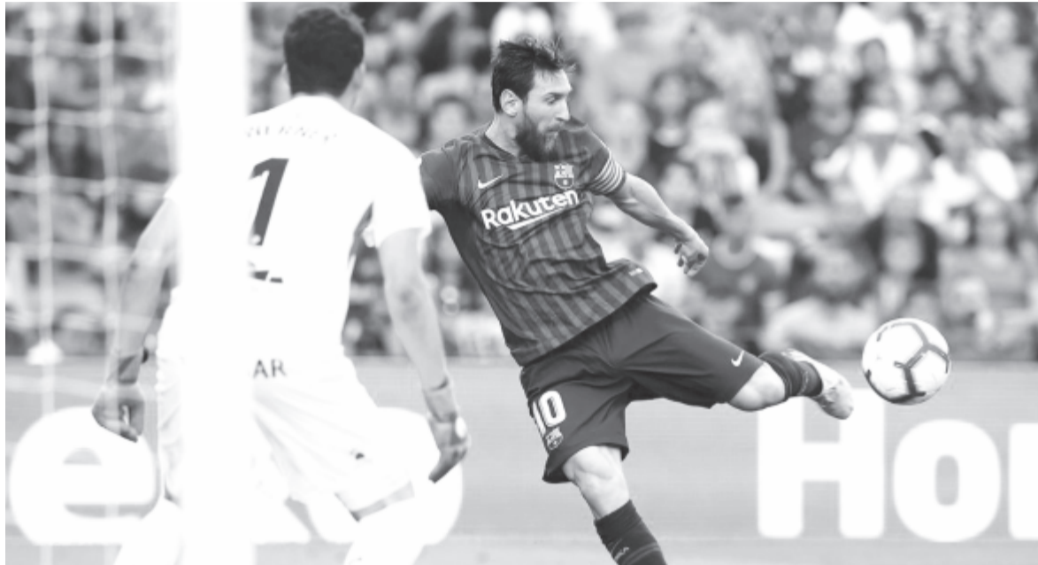
Az argentin sztár kétszer talált be azon a mérkőzésen, amelyen a Barcelona elsöpörte a Huescát, és gólzáporos győzelmének köszönhetően vezetői a tabellát a La Ligában

Barcelonának. A gránátvörös-kékek a csoportkörben az Internazionali-val, a Tottenham Hotspurrel és a PSV Eindhovenel szerepelnek azonos csoportban.