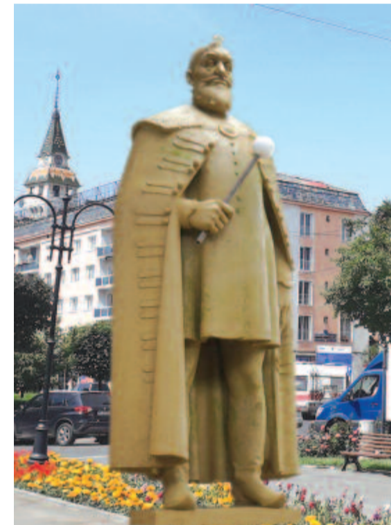
A tervezett Bethlen-szobor

Időnként lanyhuló reményeink szerint valahol a virágóra és a katona között fog állni Bethlen Gábor szobra. Ideje is lenne egy erdélyi város közepén egy erdélyi fejedelem múltidéző emlékének felállítása. Számomra akkor válna erdélyivé is Marosvásárhely főtere.